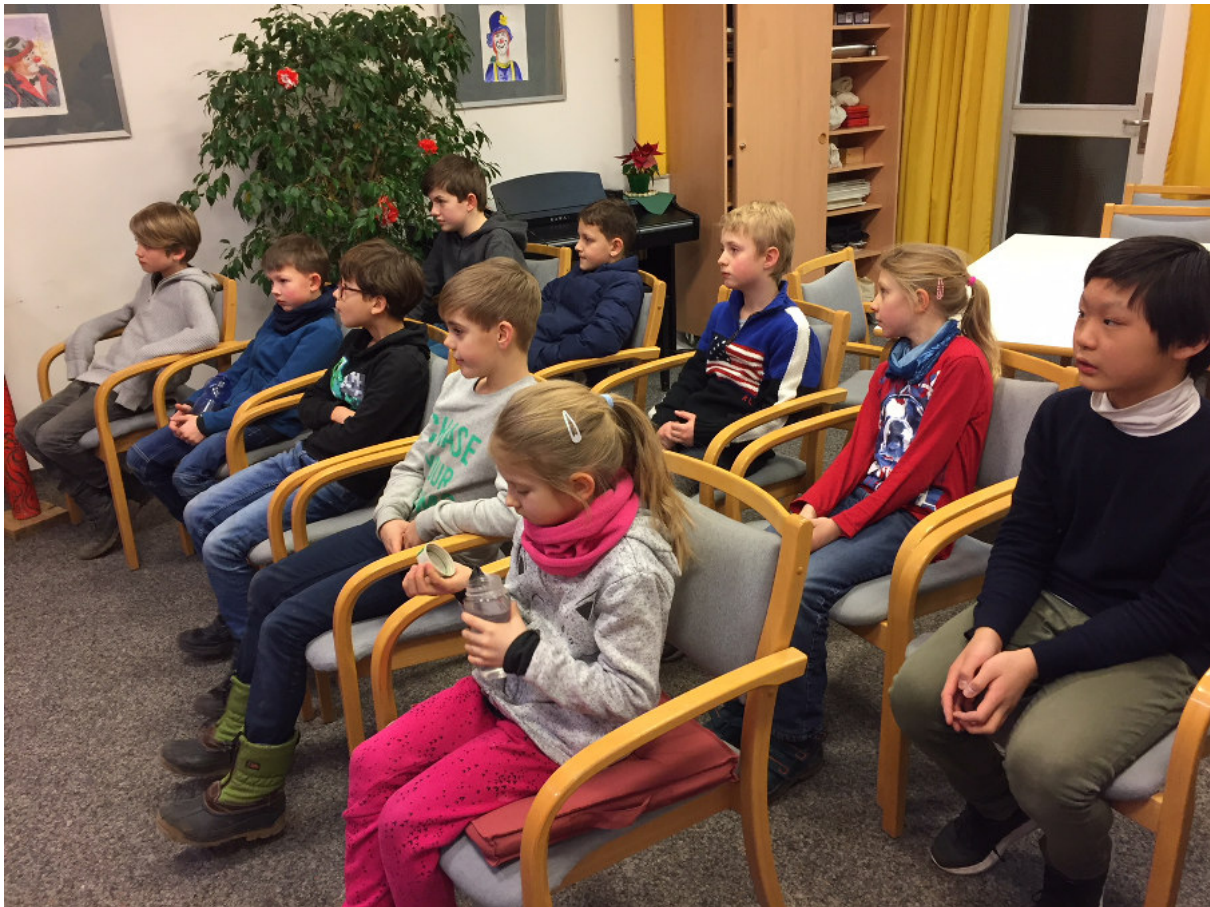
Thema am Demobrett: Randbauer