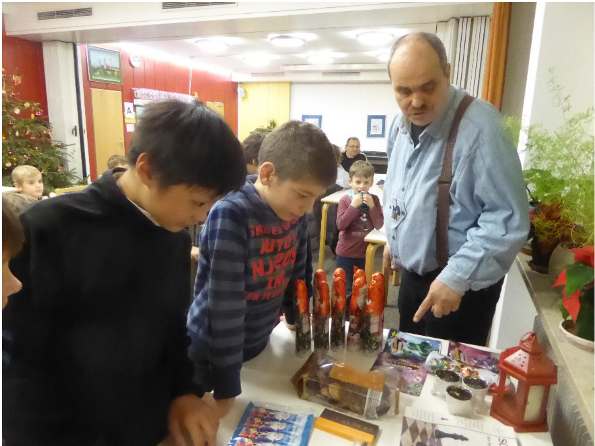
Quizmaster und Quizmeister