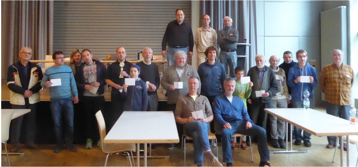
Die Preisträger und das Org-Team im Gruppenbild