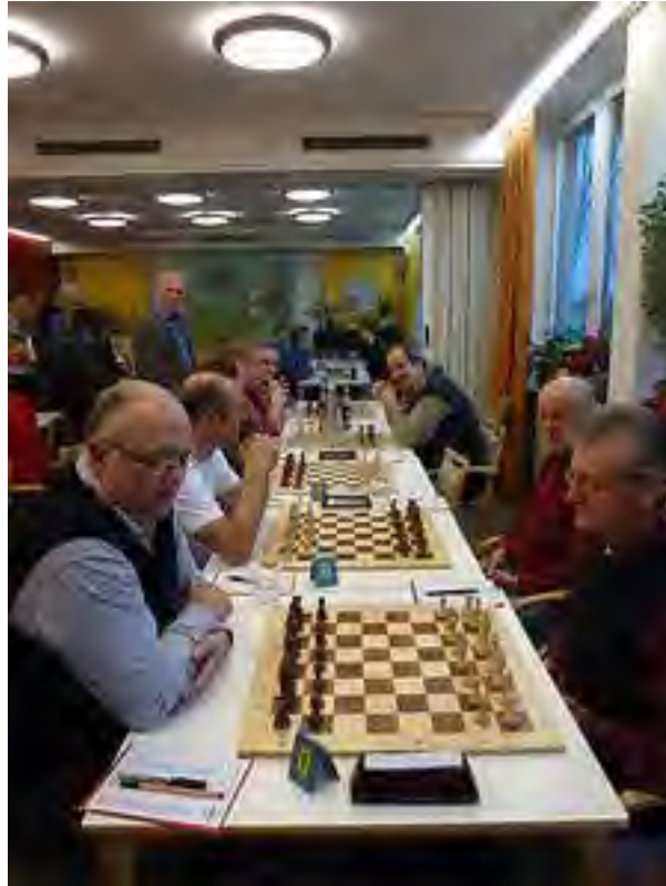
Letzter Spieltag in der A-Klasse gegen Garching