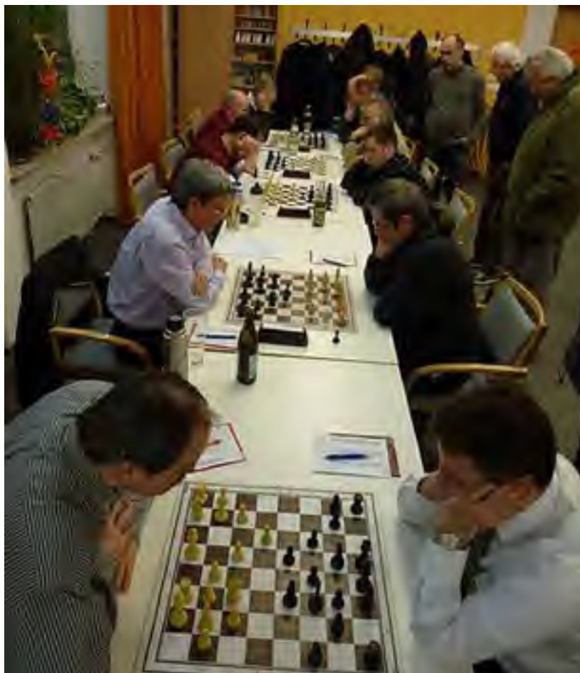
Alle Spieler bei der Arbeit