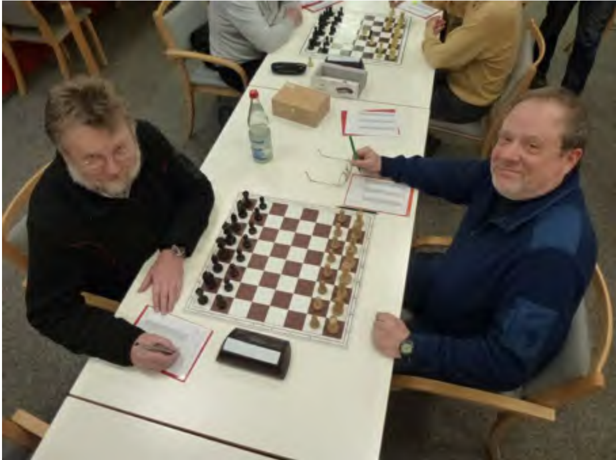
Hier geht es vorläufig noch entspannt zu