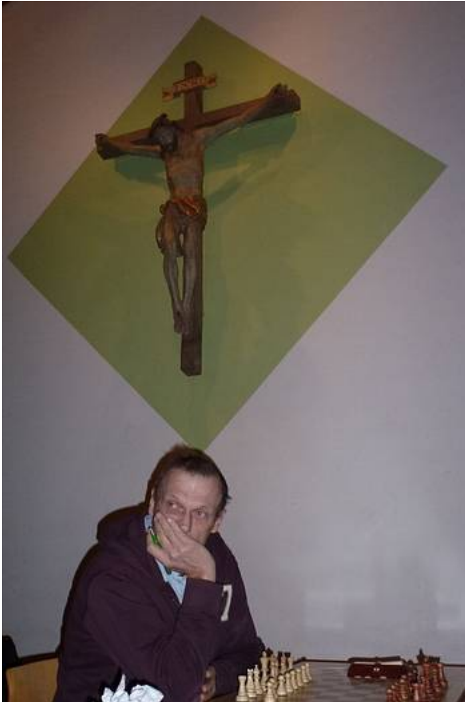
Keine ausserirdische Hilfe

Am ersten Brett in Vaterstetten gab es für uns keinen göttlichen Beistand