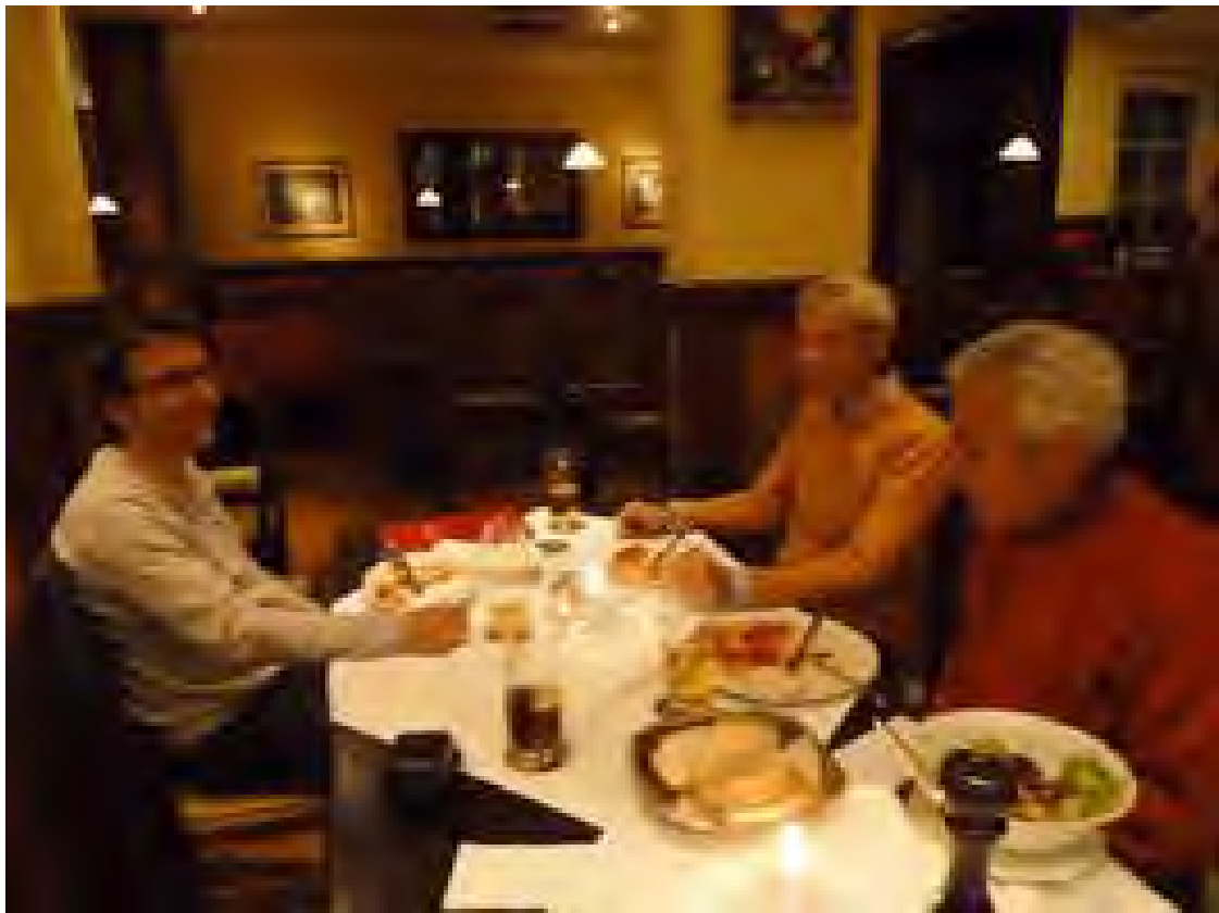
...und beim Feiern nach unserem Sieg.