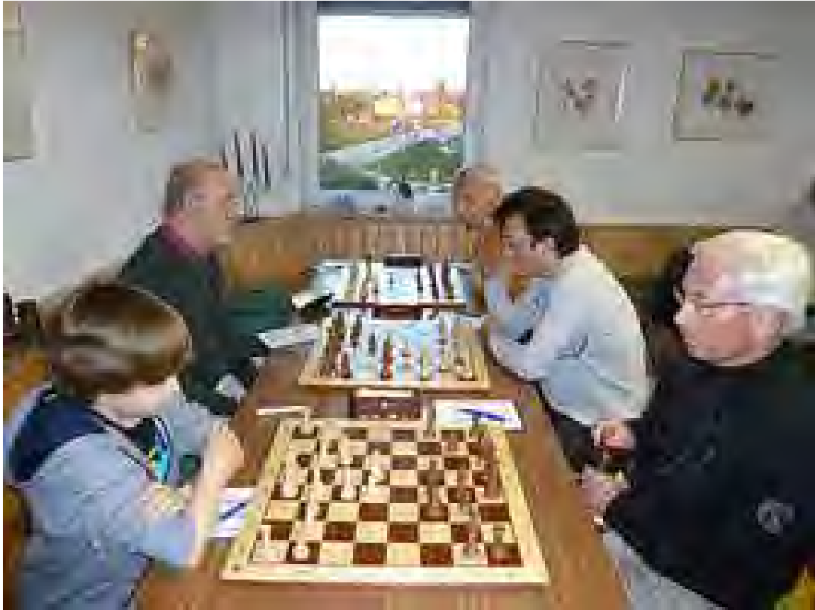
Impressionen während der 5. Runde gegen Vaterstetten...