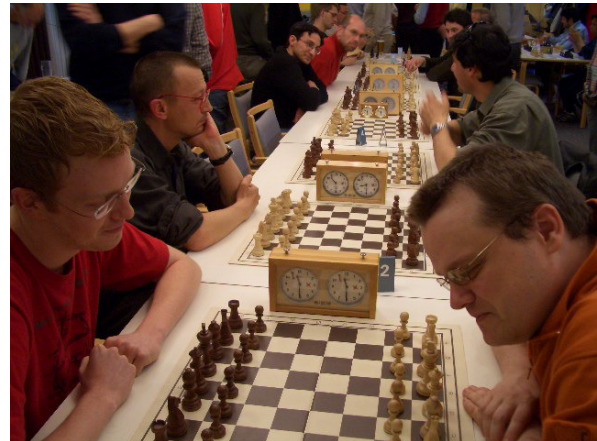
Entscheidung in der letzten Runde

In der Rochade Europa 6/2005 erschien ein Bericht über das Turnier.